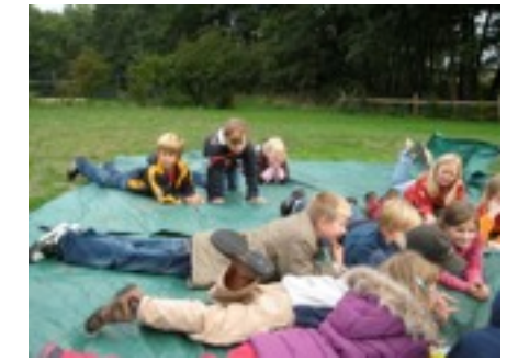
voller Eindrücke wieder nach Hause.