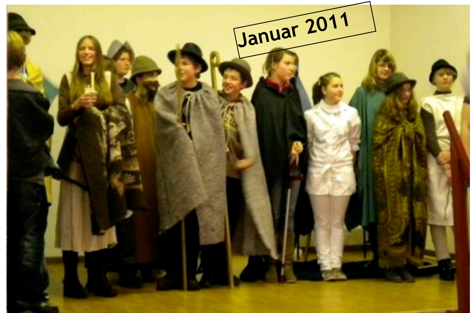
Das Krippenspiel der Konfirmandengruppe «Stern über Bethlehem» in Weiden war ein toller Erfolg. Mehr Fotos davon im Innenteil